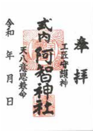
御朱印 (スタンプ) 500円