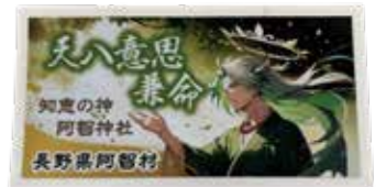
天八意思兼命 ステッカー 400円