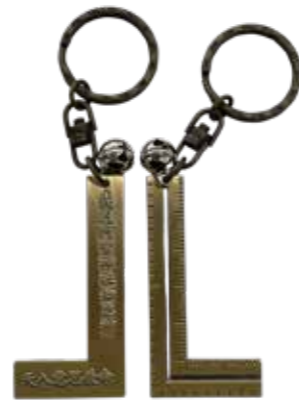
お守り/差し金 (曲尺) 800円 日本で最初に曲尺を作った神様に ちなんだ曲尺のお守りをご用意しています。