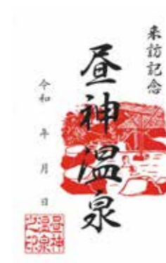
昼神温泉 来訪印 300円