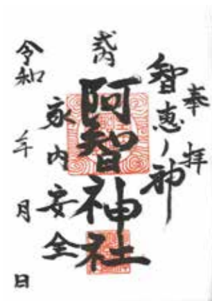
御朱印 (手書き) ※小さなお守り付き 1,000円