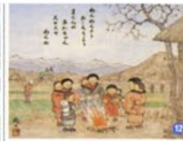
11 Inadani Dochu Theme Park 이나다니 도추(테마파크) 伊那谷道中 伊那谷道中