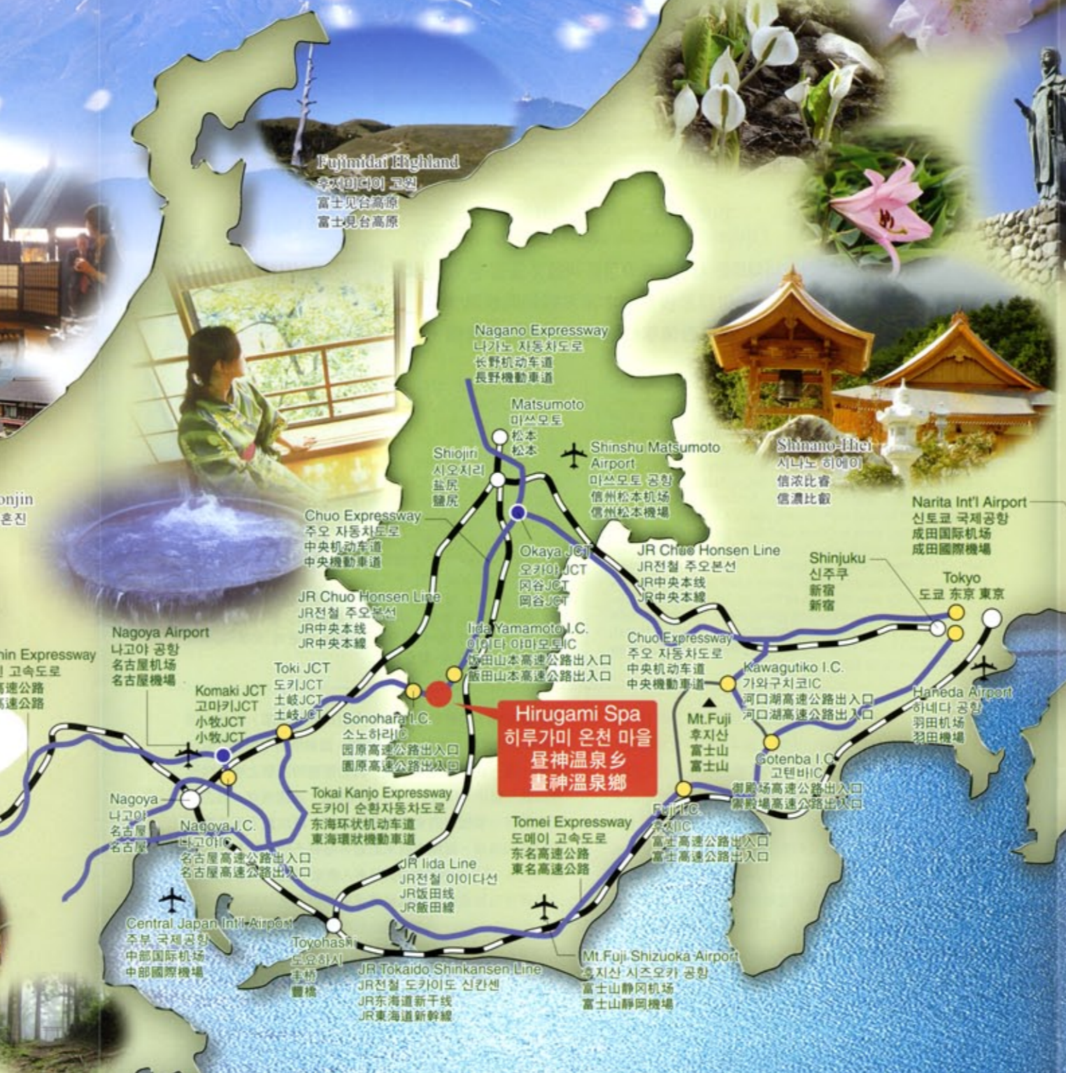
Shin-Osaka 신오사카 新大阪 新大阪