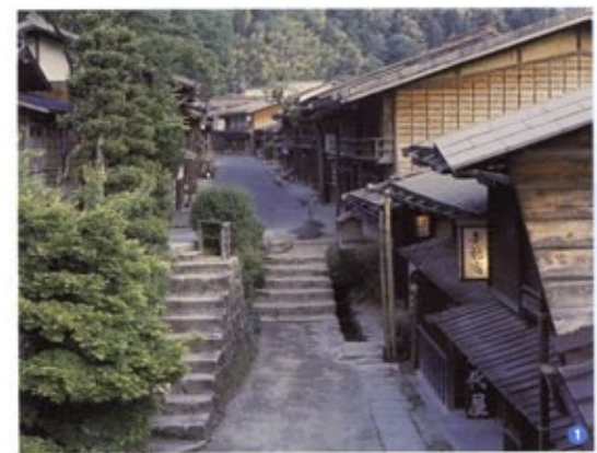
1 Tsumago-Juku 쓰마고주쿠 역참마을 妻籠宿 妻籠宿