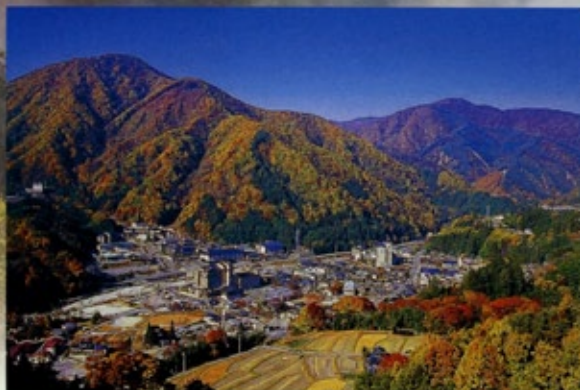
A panoramic view of the Hirugami Spa surrounded by mountains. Be amazed at the distinct four seasons.

산에 둘러싸인 히루가미 온천의 전경. 뚜렷한 계절의 변화에 감동. 由群山圍繞的覺神溫泉鄉全景。其明顯的四季變化令人心曠神怡。 由群山圍繞的覺神溫泉鄉全景。其明顯的四季變化令人心曠神怡。